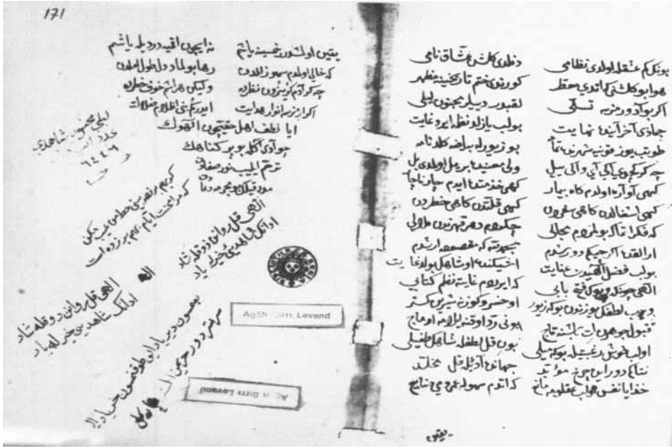
Leylâ vü Mecnun Nüsha Örneği: “Fransa Bibliothèque Nationale Nüshası (Fotokopi - Atatürk Üniversitesi- Seyfeddin Özege Bölümü, Agâh Sırrı Levend Kitaplığı)”