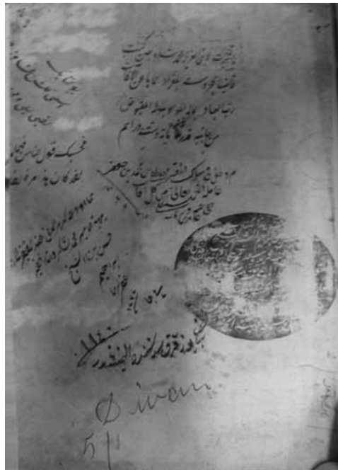
Nüsha Örneği: İzmir nüshası